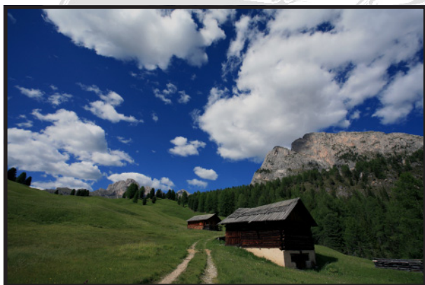
Immagine SOTTOESPOSTA Soggetto troppo AMPIO MANCANZA di incisività

Migliorata l'esposizione Taglio per decentrare Raddrizzamento dell'immagine